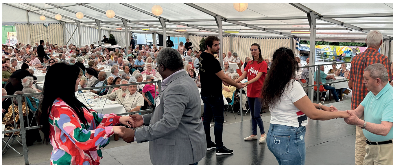
Initiation au West Coast Swing

Le Conseil administratif se réjouit de retrouver les aîné-es saconnésien-nes en fin d'année pour fêter Noël à Paexpo.