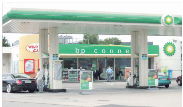
La station-service des années 2000