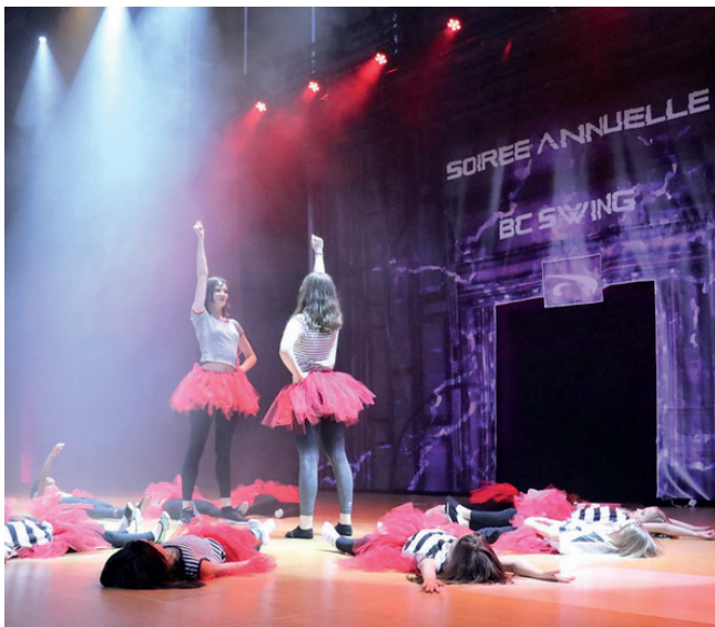
Soirée annuelle 2023 - Salle du Pommier

Le but de ces changements est de créer les structures nécessaires pour atteindre l'objectif du tout jeune comité : former des compétiteur/trices de haut niveau.