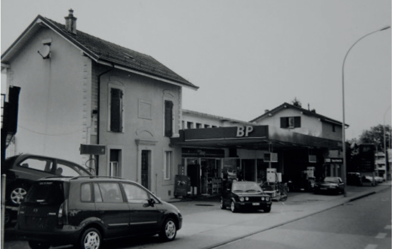
Le garage dans les années 80