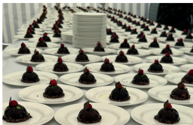
Service du dessert par le traiteur Genecand