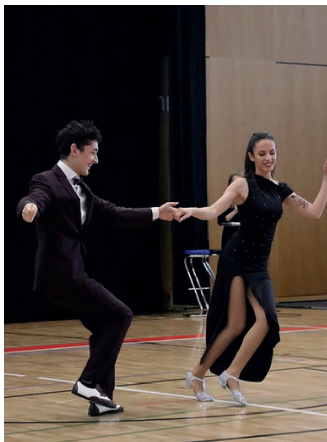
SRRC Cup - Le Grand-Saconnex - 22 avril 2023

La passion pour nos sports et notre club, les grandes amitiés qui se lient au sein du club, la vie associative animée et variée, la confiance que nous avons les un-es en les autres, la diversité et la collaboration entre les membres sont les vrais moteurs qui font vivre le BC Swing. Nous sommes très fiers de notre philosophie et de notre modèle de club, et nous tâchons de transmettre cela aux générations futures pour s'assurer de l'existence du BC Swing et de sa philosophie pour de nombreuses années encore.