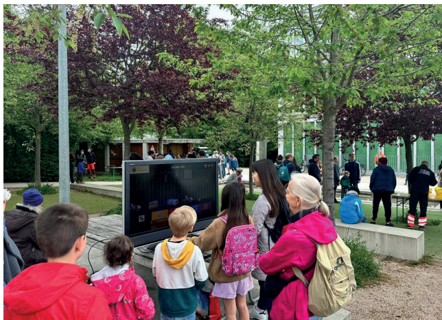
Tri virtuel de déchets sur console

Un collaborateur de la commune est venu bénévolement nous présenter une console de jeu dont il est le créateur. Tous les enfants (et certains adultes) se sont initiés à ce tri virtuel de déchets dont la cadence augmente plus les réponses sont exactes. Montée d'adrénaline assurée !