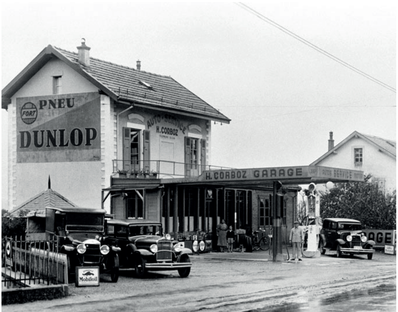
Le garage dans les années 30

Il achète l'établissement de crèmerie-pâtisserie Vidal, à la route de Ferney 187. Un tea-room, dirait-on maintenant.