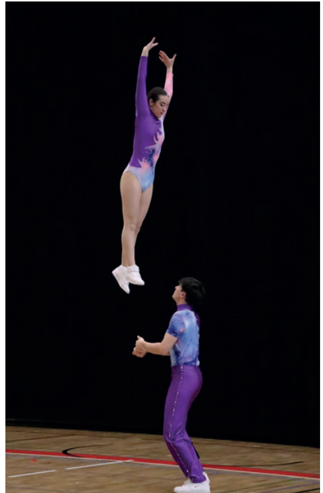
SRRRC Cup - Le Grand-Saconnex - 22 avril 2023

Le BC Swing est affilié à la Swiss Rock'n'Roll Confederation (SRRRC), elle-même membre de la World Rock'n'Roll Confederation (WRRRC), et de l'Association Olympique Suisse (AOS).