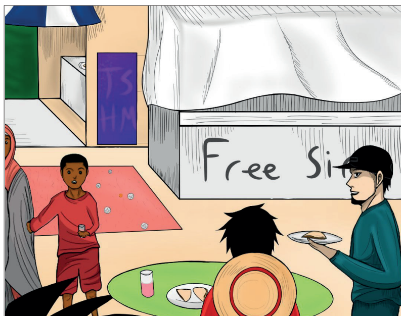
Dessin réalisé par un jeune du Grand-Saconnex

Retrouvez le programme détaillé dans la rubrique agenda du site www.grand-saconnex.ch !