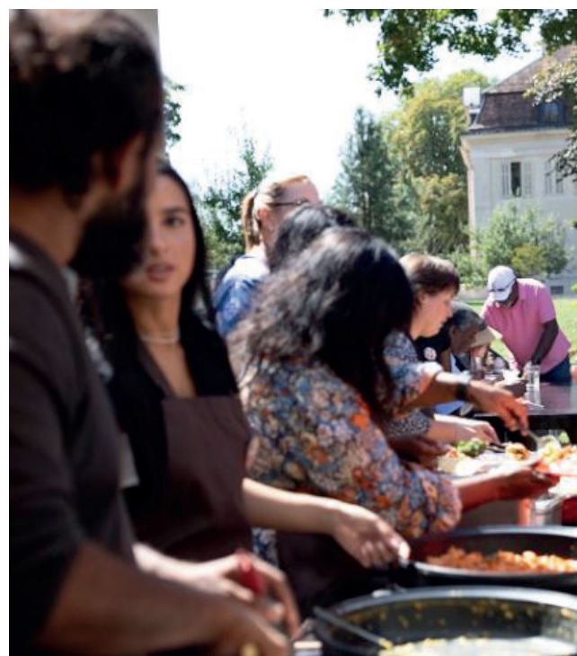
Cuisine du monde pour le repas de midi