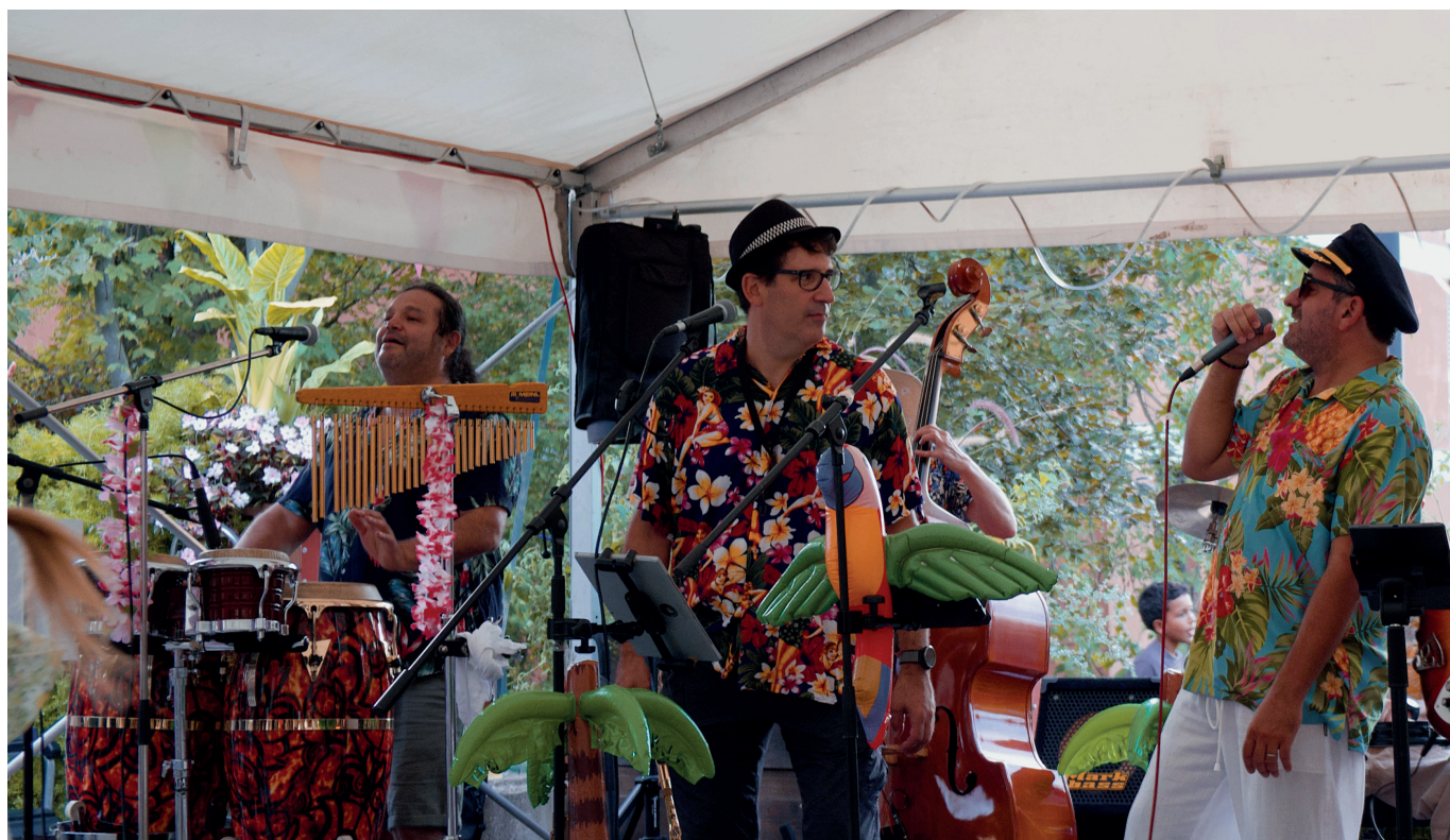
Groupe de musique Mango Chacha