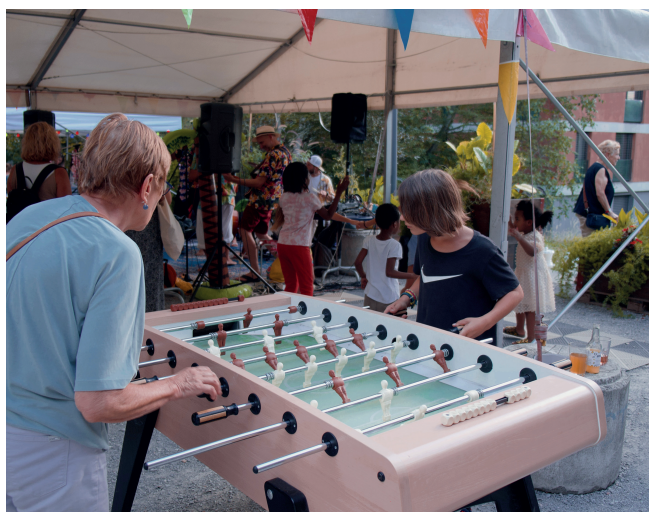
Tournoi de baby-foot

La Fête de la Ferme Pommier s'est déroulée le samedi 2 septembre dernier, sous un soleil radieux. De 11h à 22h, les habitant-es et associations communales proposant des activités sur ce site, ont pu offrir différentes animations. A travers le son d'une playlist de musiques choisies par les visiteurs et visiteuses, tout le monde a pu déambuler et profiter des différentes activités proposées.