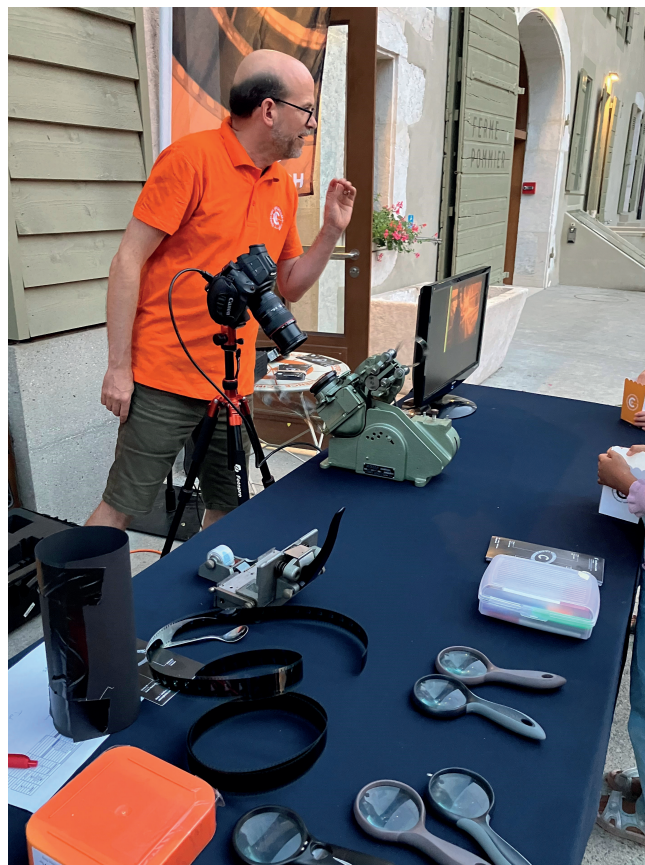
Atelier : comment créer une petite animation sur pellicule ?