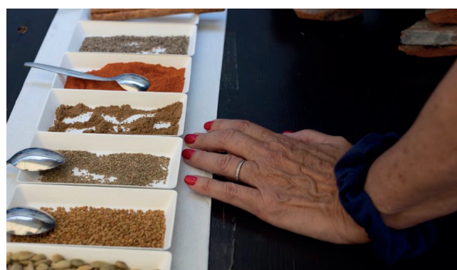
Epices sri-lankaises pour la préparation de certains plats

L'ambiance a été festive et joyeuse et nous nous réjouissons de renouveler ce type d'évènement convivial à la Ferme Pommier.